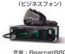
北米：Bearcat880 (CBトランシーバー)