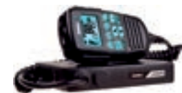
オーストラリア：UH405SX (トランシーバー)