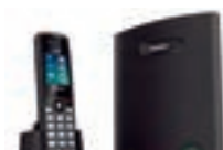
北米：DECT4096 (ビジネスフォン)