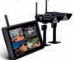
ガーディアンシリーズ (ワイヤレスカメラ)